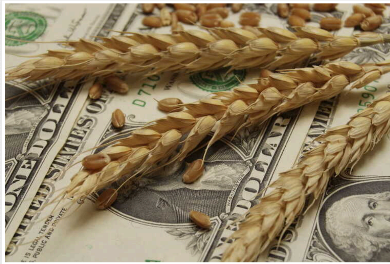
Bloomberg: Із серпня 2023 року світові ціни на пшеницю зросли до максимуму

Аналітики пов'язують зростання цін із погодними умовами, зокрема із заморозками, і передбачають подальше підвищення вартості зернових культур.