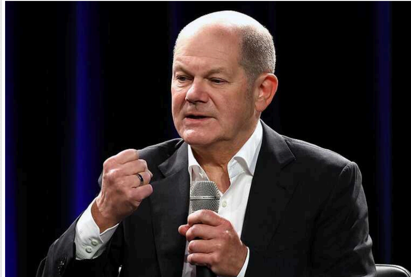
Це може стати значущим кроком, - канцлер Німеччини про Глобальний саміт миру

Німецький канцлер Олаф Шольц вбчає можливості у запланованому на червень 2024 року Саміті миру щодо України.