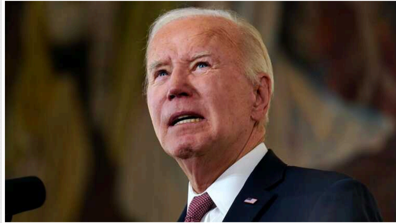
Якщо ХАМАС звільнить заручників, перемир'я у секторі Гази настане завтра, - Байден

Президент США Джо Байден заявив, що запровадження режиму припинення вогню у секторі Гази залежить від урегуливання ХАМАС.