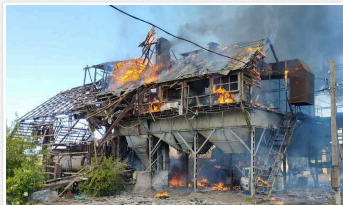
На Донеччині за добу окупанти обстріляли 10 населених пунктів: дві людини дістали поранення

За 11 травня російські загарбники атакували Курахове, Новозродівку, Селидове, селища Гостре, Курахівка, села Дорожжє, Миколаївка, Новожеланне, Новоселівка Перша, Яблунівка.