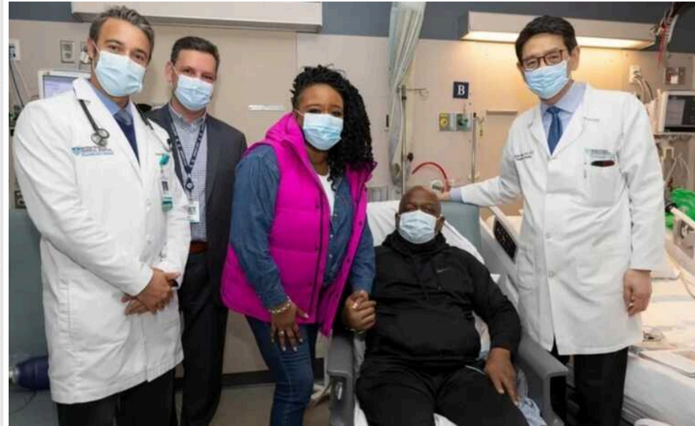
У США померла людина, якій вперше трансплантували нирку від генетично модифікованої свині

Перший пацієнт, якому пересадили генетично модифіковану свинячу нирку, помер майже через два місяці після трансплантації.