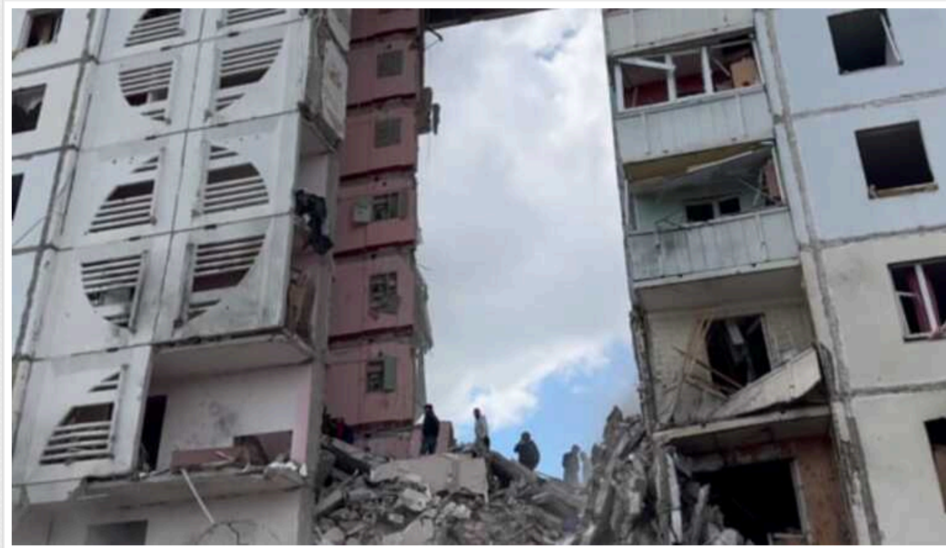
Влучання ракети чи чергова провокація: Що відомо про обвал будинку в Белгороді

У Белгороді внаслідок влучання ракети (ймовірно від російської ППО), частково обвалилася багатоповерхівка. РосЗМІ пишуть уже про 4 загиблих, ведуться розбори завалів.