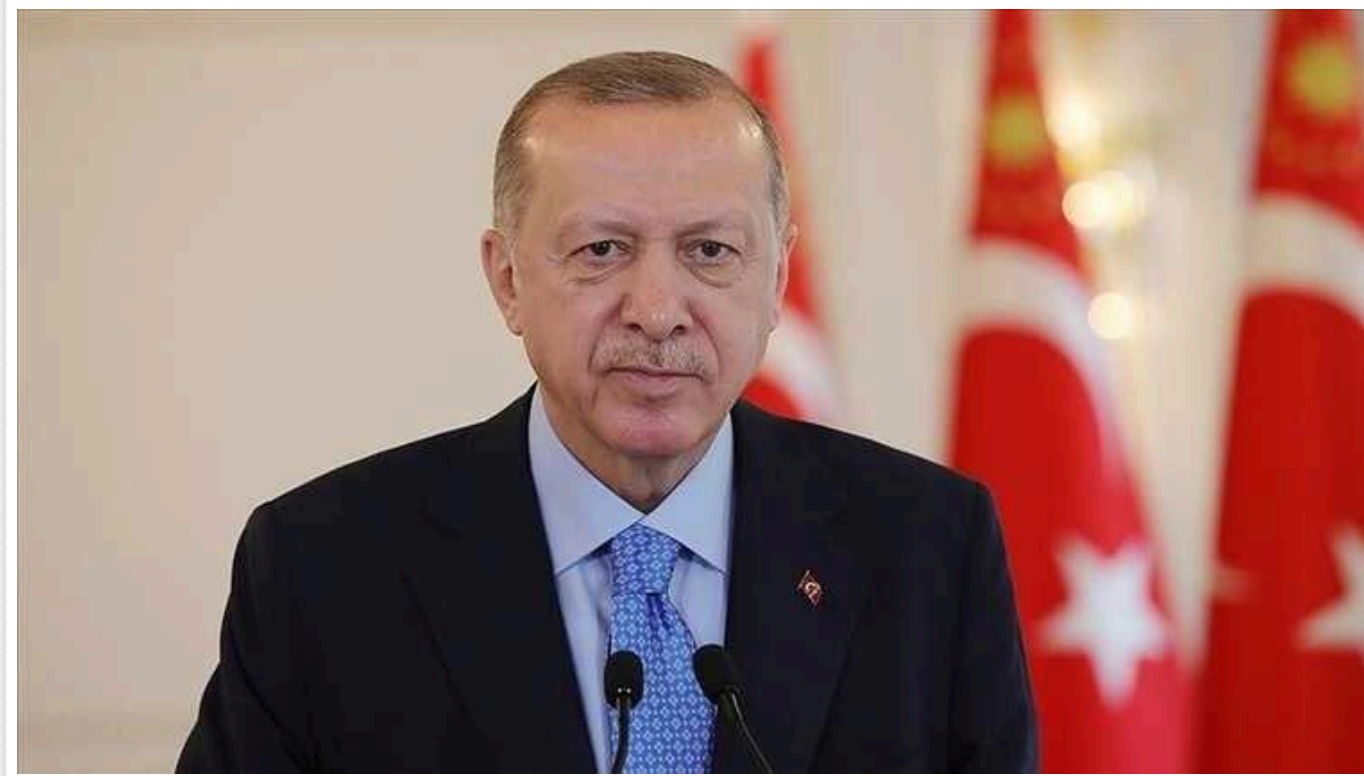
Президент Туреччини пояснив, чому відклав свій візит до США

Президент Туреччини Реджеп Тайп Ердоган прокоментував причини перенесення свого візиту до Вашингтона для зустрічі з президентом США Джо Байденом у Білому домі 9 травня.