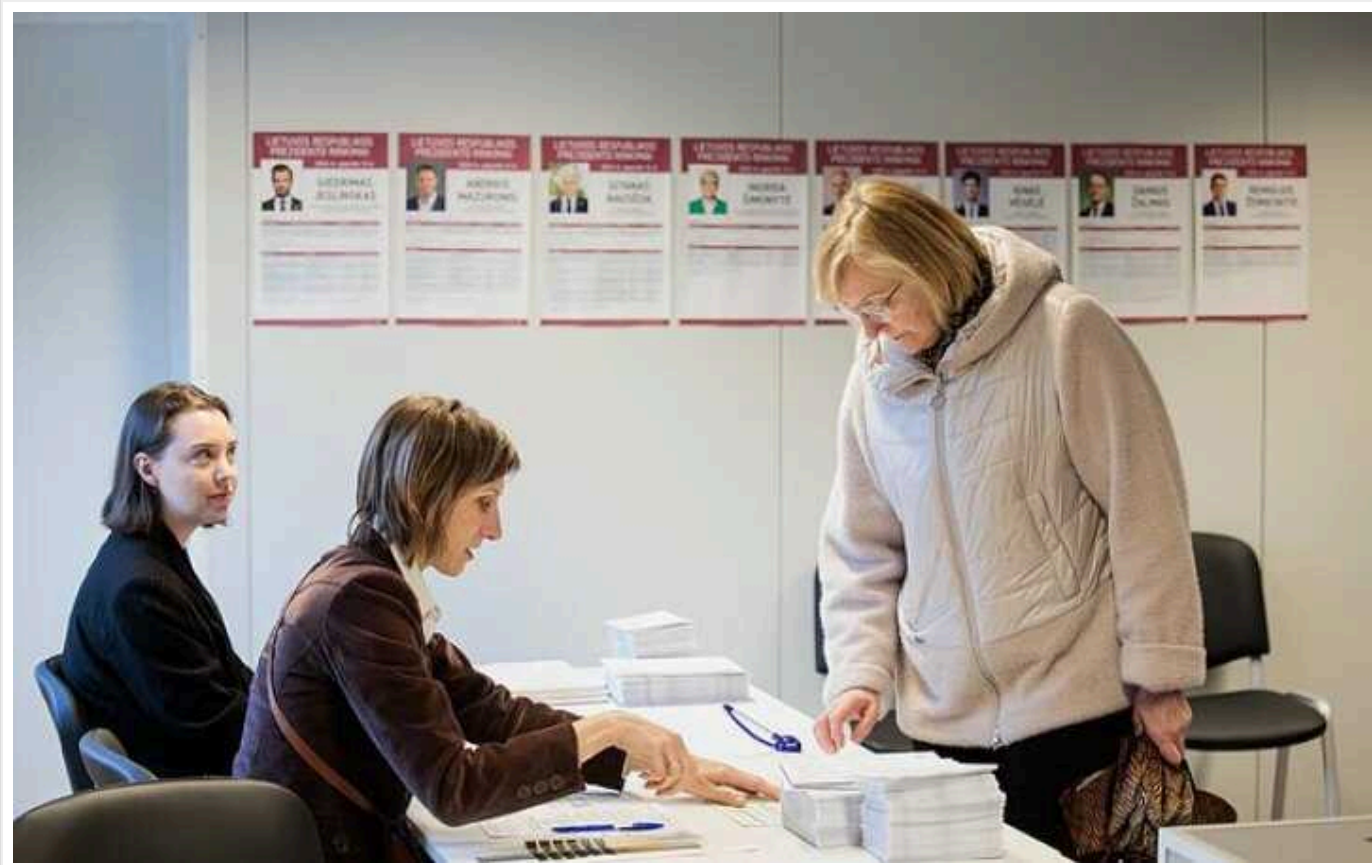
У Литві стартували президентські вибори та референдум

У Литві 12 травня проходять вибори, під час яких громадяни обиратимуть главу держави на найближчі 5 років. Згідно з останніми опитуваннями, фаворитом виборчих перегонів є чинний глава держави Гітанас Науседа.