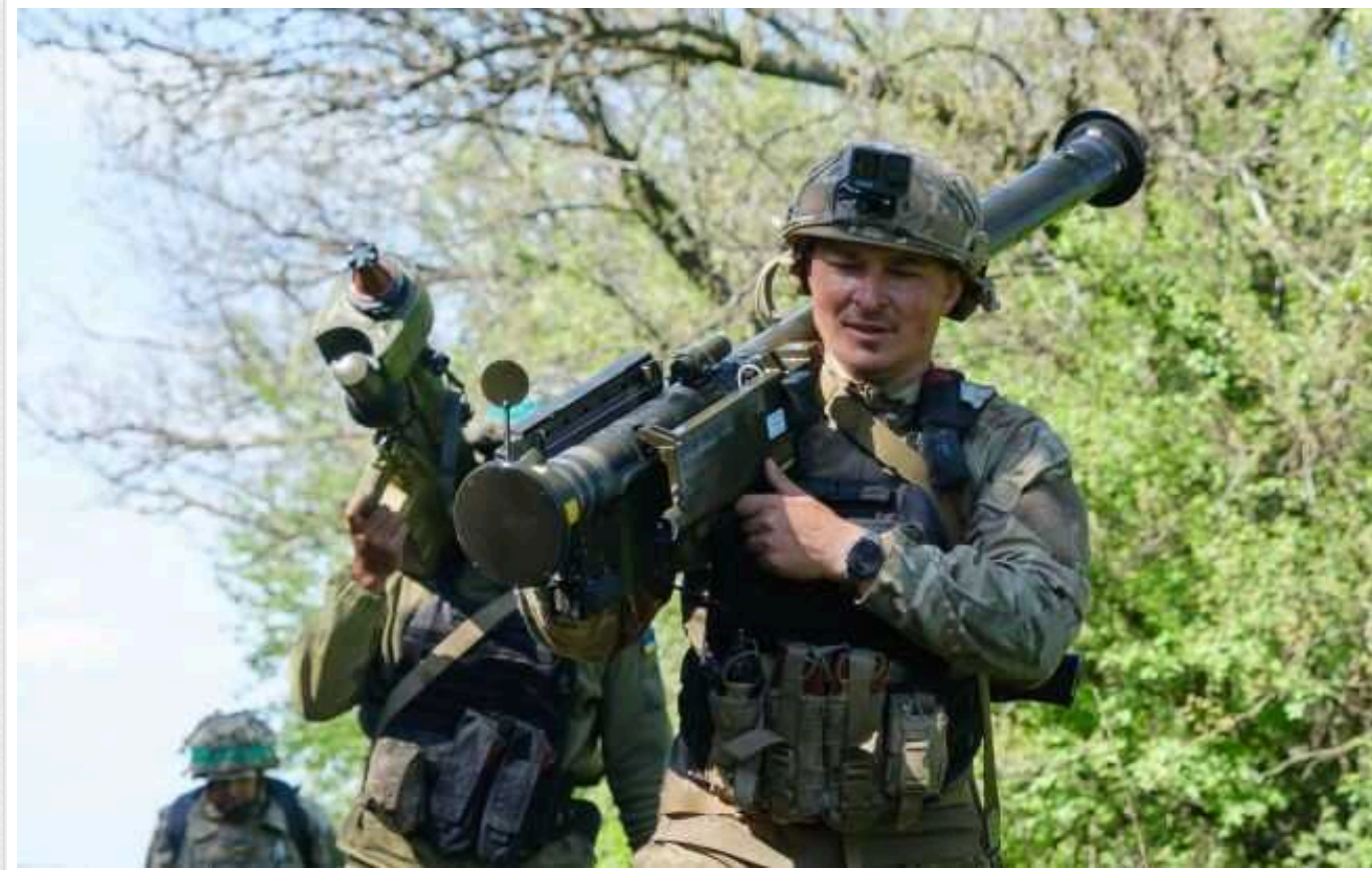
Ситуація на фронті: за минулу добу сталося 155 бойових зіткнень