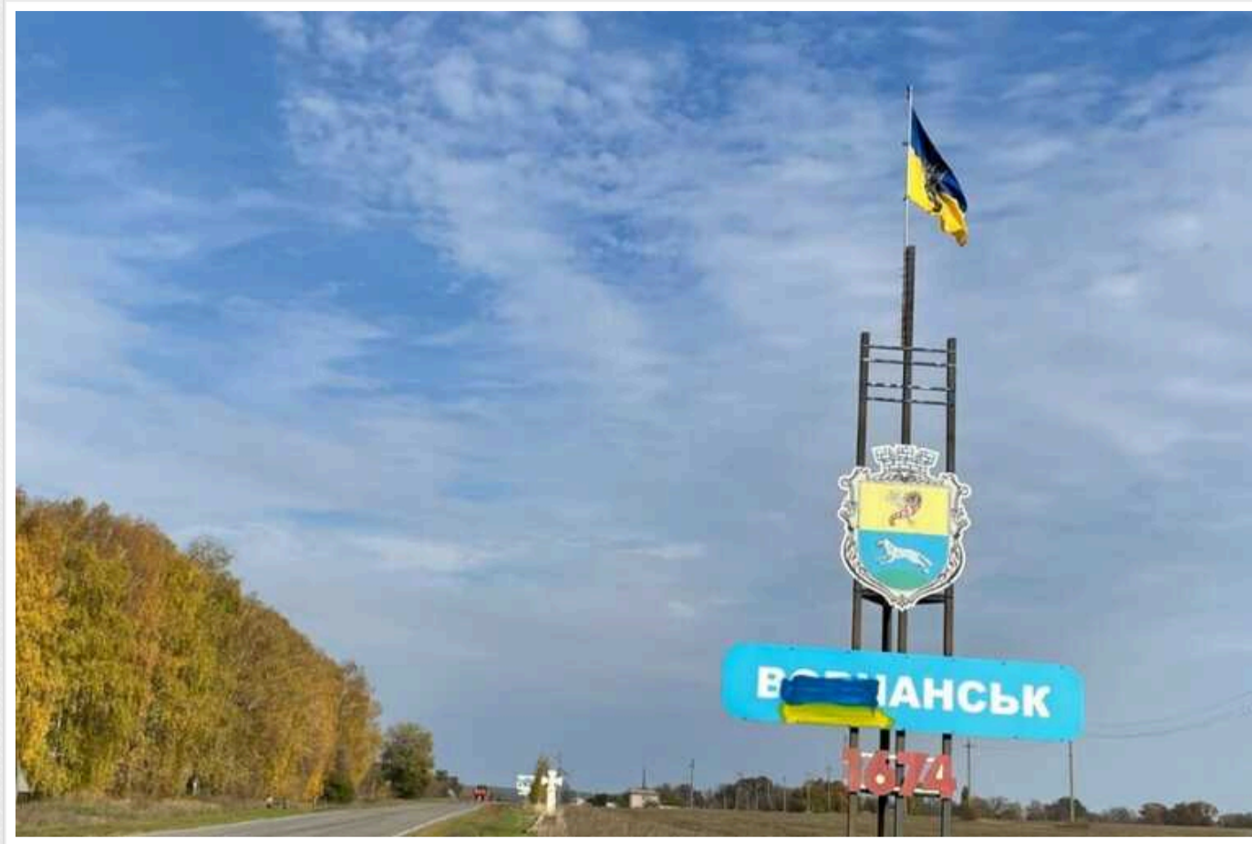
В ISW пояснили, навіщо росіяни хочуть захопити Вовчанськ у Харківській області

У Харківській області російські війська, ймовірно, намагаються швидко ізолювати простір бойових дій на схід від річки Сіверський Донець і захопити Вовчанськ – напрямком просування, який, можливо, на думку російського командування, може загрозувати українському угрупованню, яке обороняється на Куп'янському напрямку.