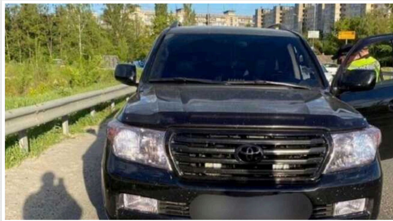
У Києві затримали двох чоловіків, які погрожували пістолетом і ножем відвідувачам АЗС

Водій та пасажир позашляховика Toyota вчинили сварку з жінкою та її чоловіком. В результаті конфлікту один з чоловіків вдарив жінку та погрожував присутнім пістолетом та ножем.