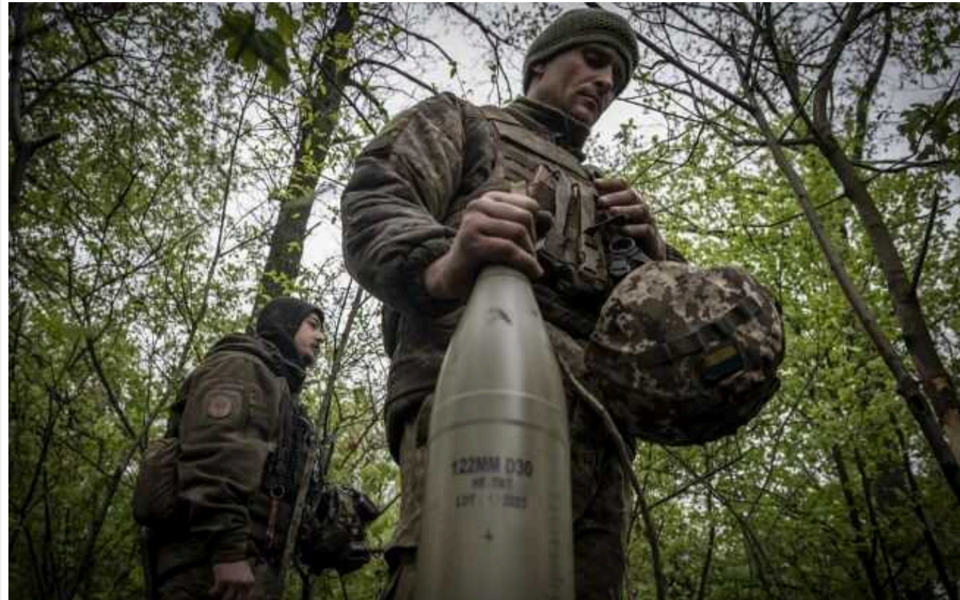
Підрозділ "Химери" розгромив танки окупантів на Вугледарському напрямку

Українські захисники продовжують ефективно знищувати особовий склад армії держави-окупанта та їхню техніку. Цього разу відзначились бійці "Химери" 20-ї ОБСП Окремої президентської бригади на Вугледарському напрямку.