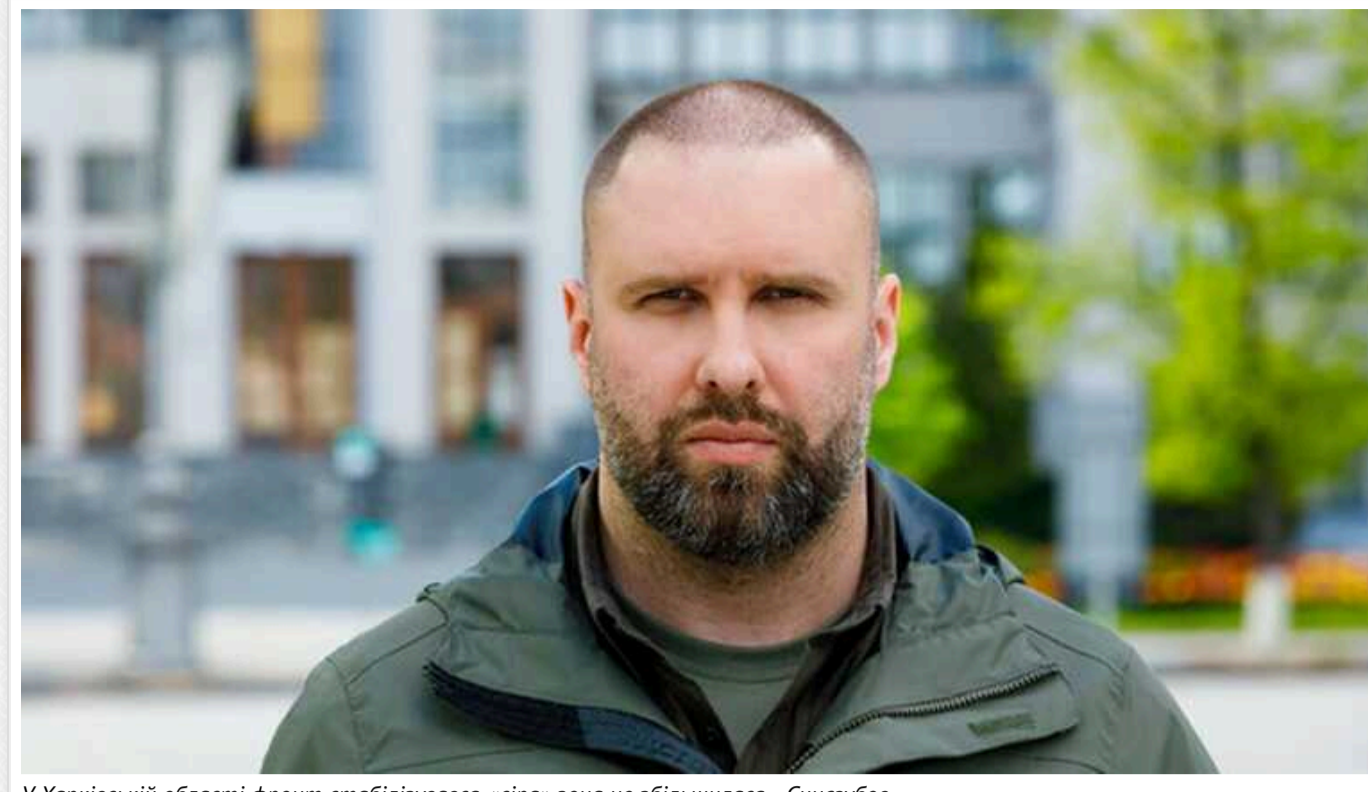
У Харківській області фронт стабілізувався, «сіра» зона не збільшилася, - Синегубов

Голова Харківської обласної військової адміністрації Олег Синегубов заявив, що станом на зараз «сіра» зона не збільшилася, фронт стабілізувався.