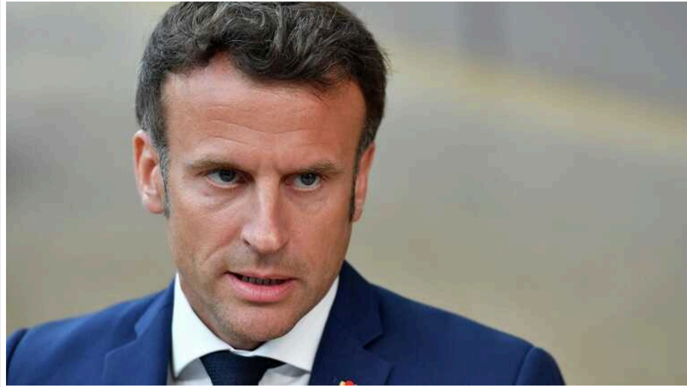
Макрон пообіцяв Україні більше зброї найближчими тижнями і попередив окупантів

Президент Франції Емманюель Макрон анонсував збільшення допомоги Україні, зокрема постачань військової техніки. Він також попередив: якщо Москва заїде надто далеко, Європа повинна бути готовою діяти, щоб захистити мир.