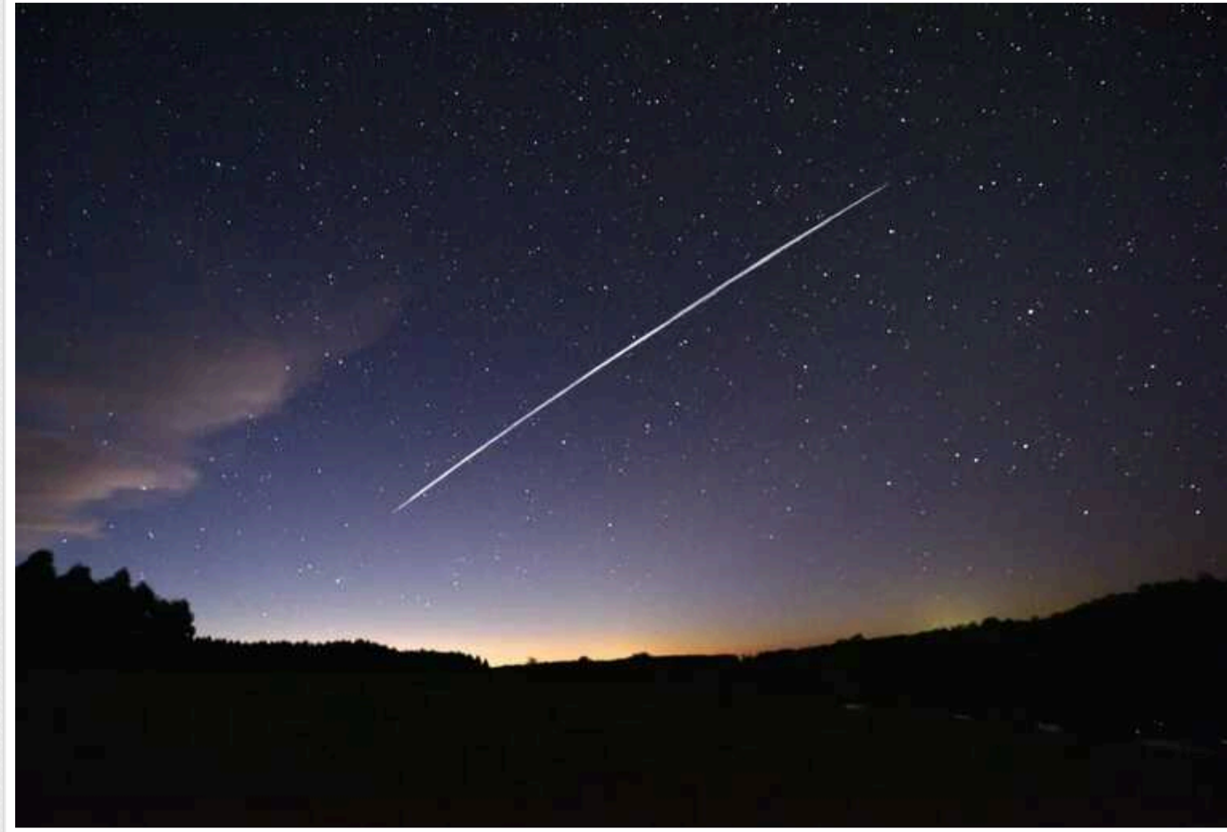
Через сильну магнітну бурю можливе "погіршення якості обслуговування", - Starlink

Reuters пише, що Starlink попередив про "погіршення якості обслуговування" через сильну магнітну бурю.