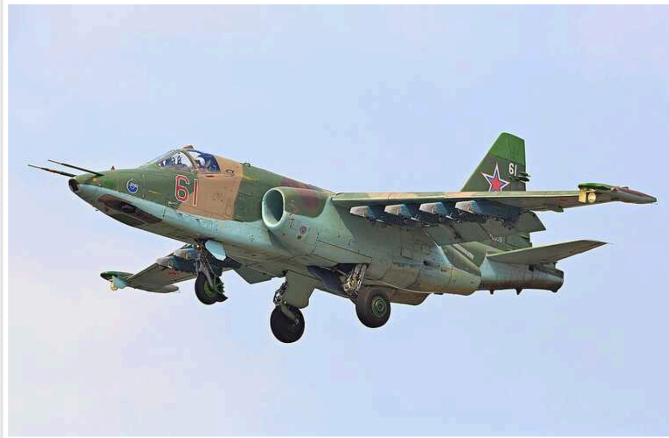
Українські зенітники на сході збили черговий ворожий СУ-25

Українські воїни продовжують "демілітаризацію" російської авіації. На одному із напрямків зенітники 110-ї бригади 11 травня уразили ворожий Су-25.