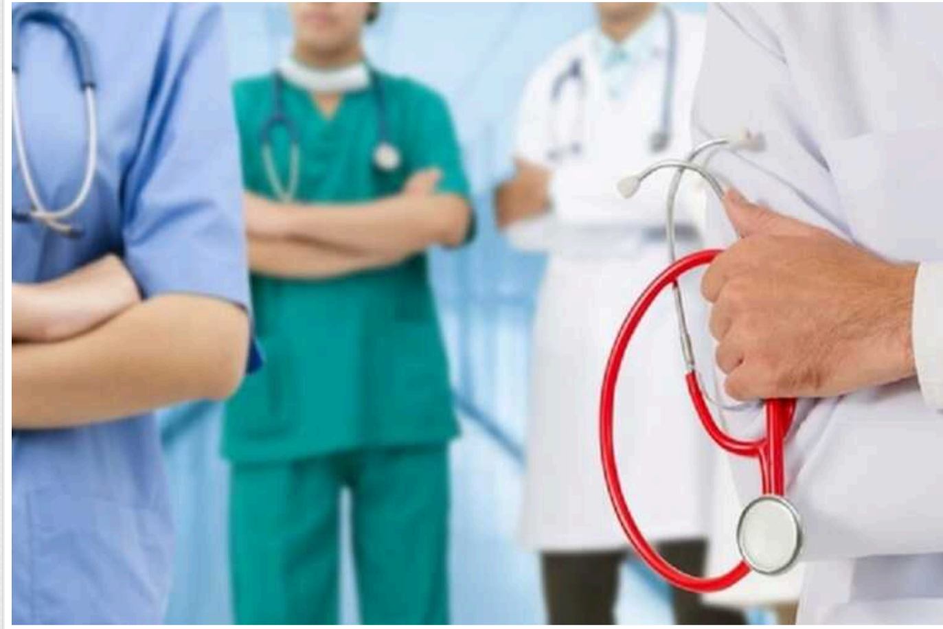
У Києві співробітники закладу торгівлі та їхні родичі захворіли на вірусний гепатит А

У Києві та Київській області лікарі зафіксували 5 випадків захворювання на вірусний гепатит А. Пацієнтами лікарів виявилися співробітники та члени їхніх родин одного із закладів торгівлі столиці.