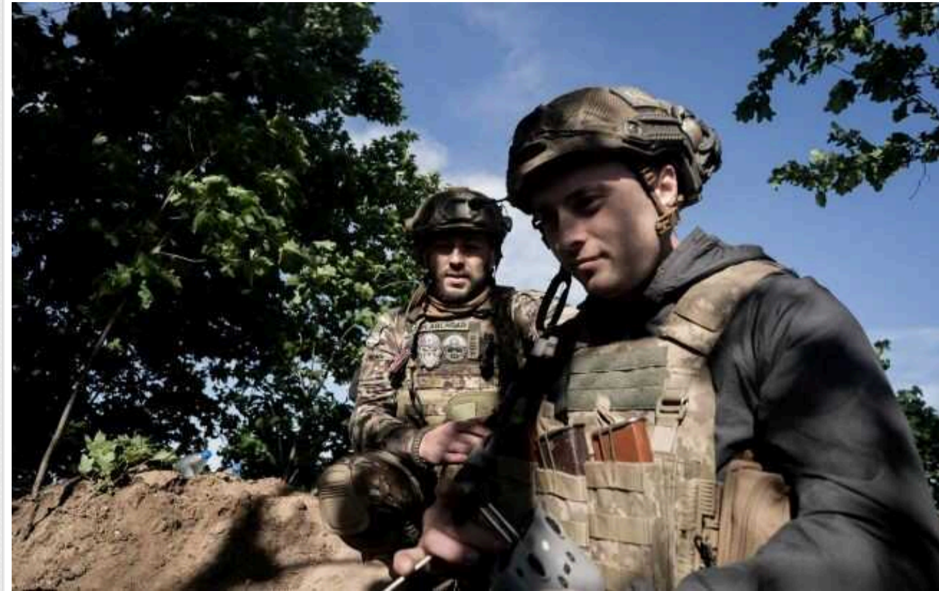
В ОСУВ "Хортиця" розповіли про ситуацію на Харківщині: "Є рішення про посилення підрозділів ЗСУ"

Українські військовослужбовці дають опір російським загарбникам на півночі Харківської області. У свою чергу путінська армія продовжує застосовувати для атаки піхоту та бронетехніку.