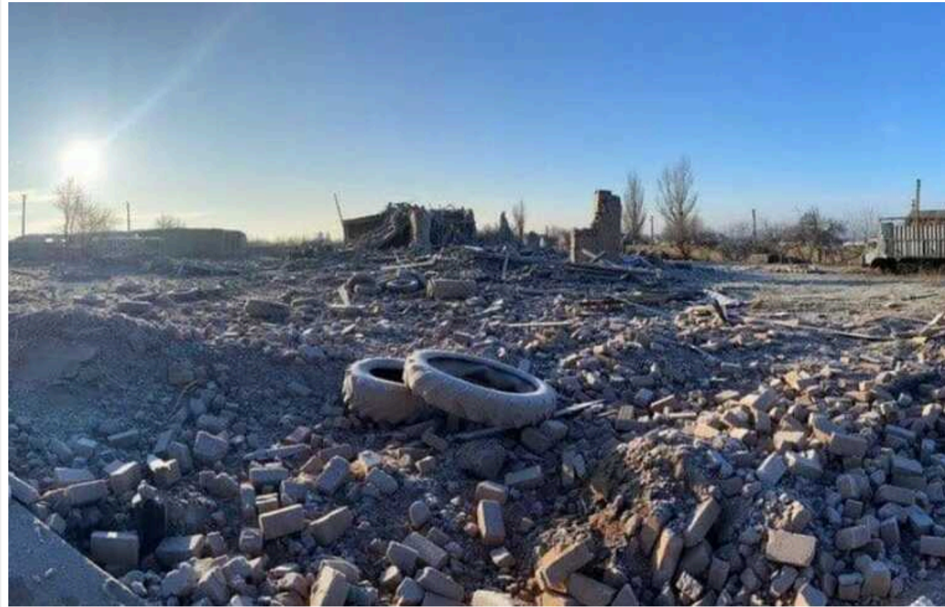
Окупанти завдали удару по Херсонщині: загинув чоловік, поранено жінку

Російські окупанти у ніч проти 11 травня вкрили вогнем Тягинку Бериславського району Херсонської області. Один з запущених загарбниками КАБів влучив у приватний будинок.