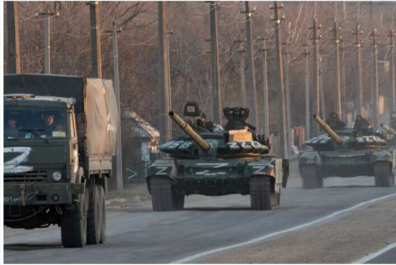
WSJ: На півночі Харківської області війська РФ вчора досягли «тактично значущих успіхів»

Ця операція швидше за все "має обмежені оперативні цілі, але покликана досягти стратегічного ефекту відволення української живої сили та техніки з інших критичних ділянок фронту".