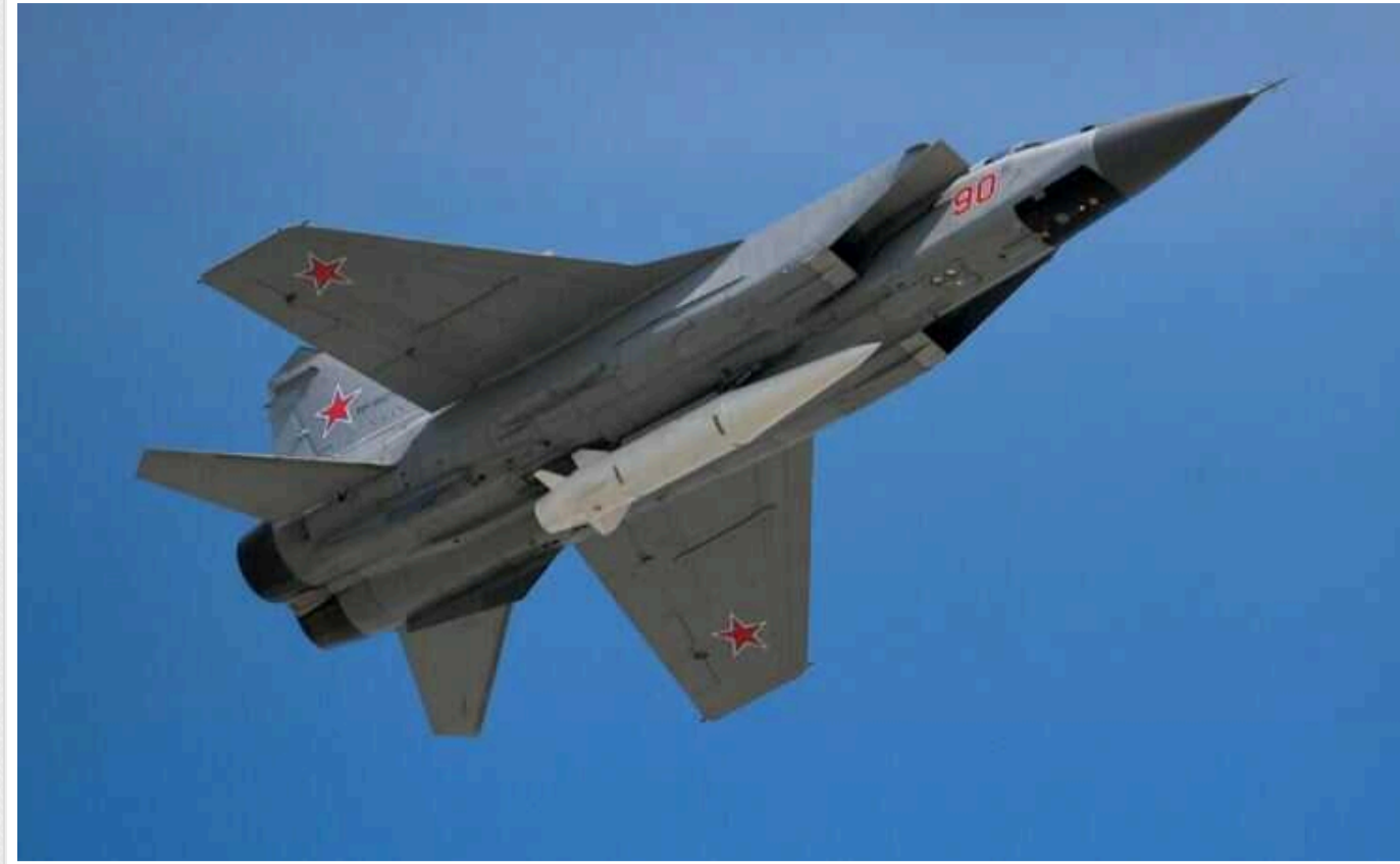
ГУР опублікувало список російських пілотів, які обстрілюють Україну «Кинджалами»

Розвідники дізналися імена російських пілотів, які обстрілюють територію України "Кинджалами". У списку 29 льотчиків.