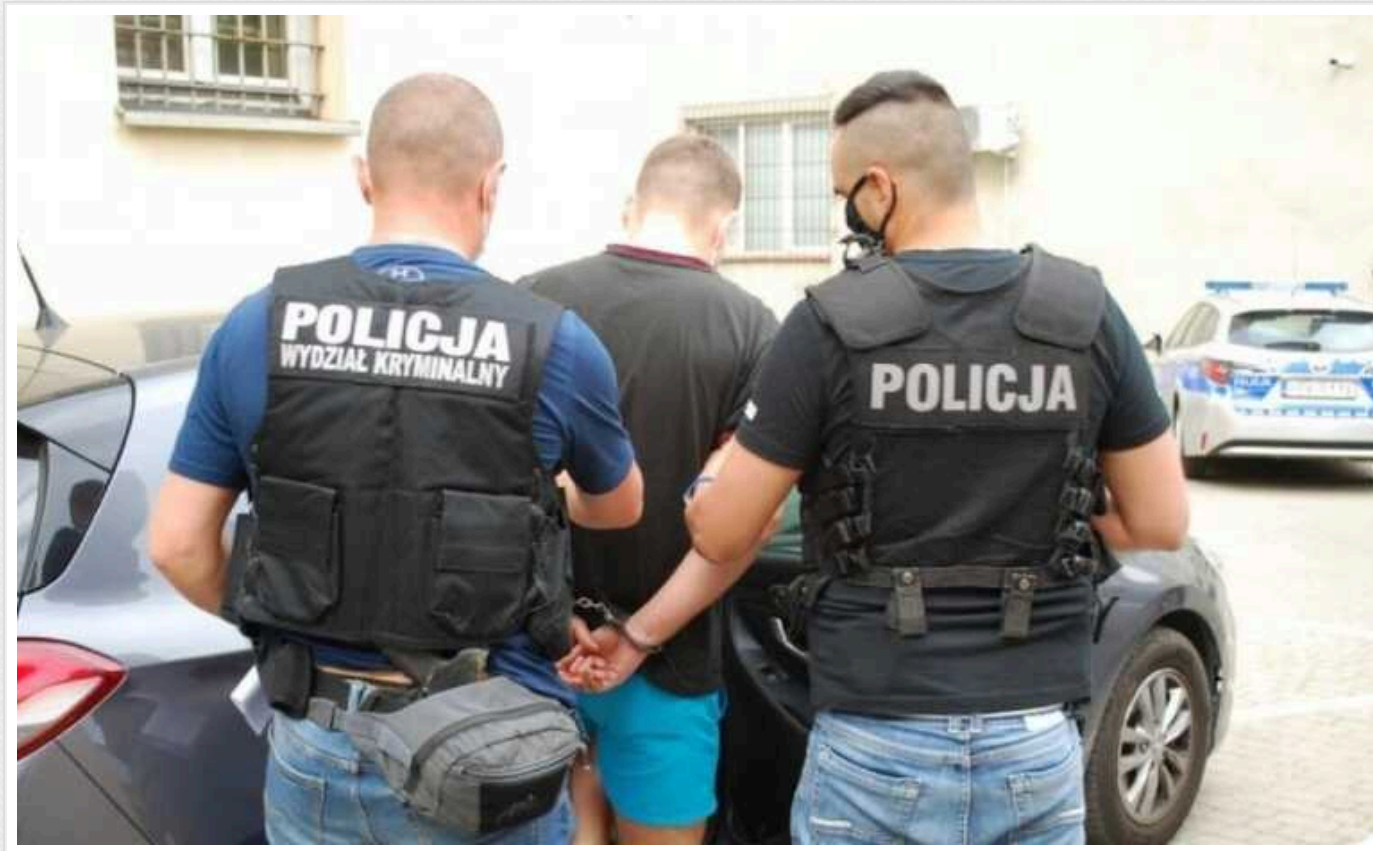
У столиці Польщі затримали українця, який займався відмиванням грошей, йому загрожує екстрадиція до США

Співробітники кримінального відділу поліції Волі затримали 28-річного громадянина України, який розшукувався Інтерполом за «Червоним повідомленням» за відмивання грошей та шахрайські дії.