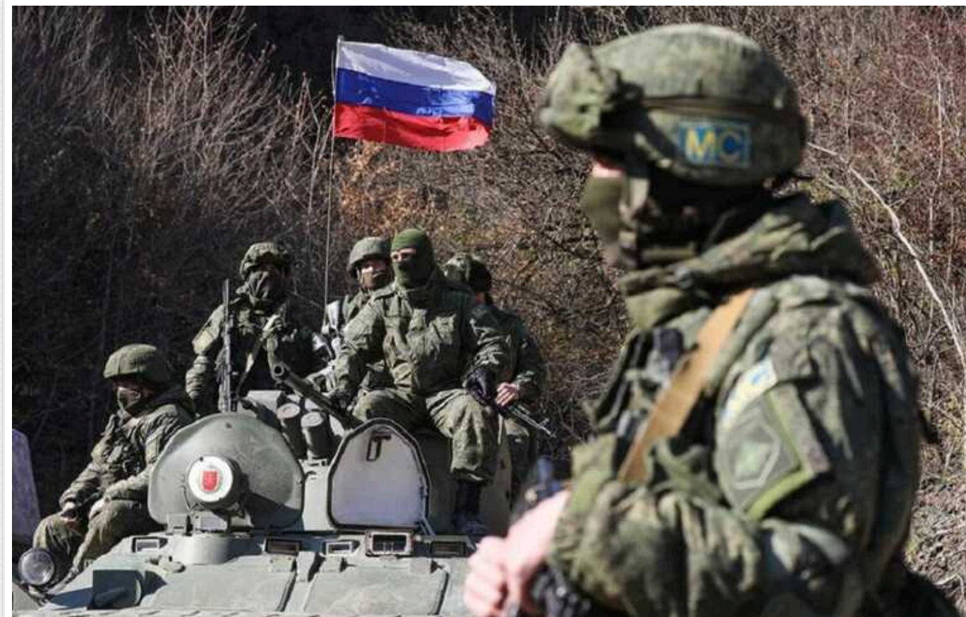
Російські загарбники відмовляються атакувати Харків, – «АТЕШ»

Військовослужбовці одного з відділень мотострілецького батальйону 44 армійського корпусу ЗС РФ навідріз відмовилися йти на штурм у Харківській області.