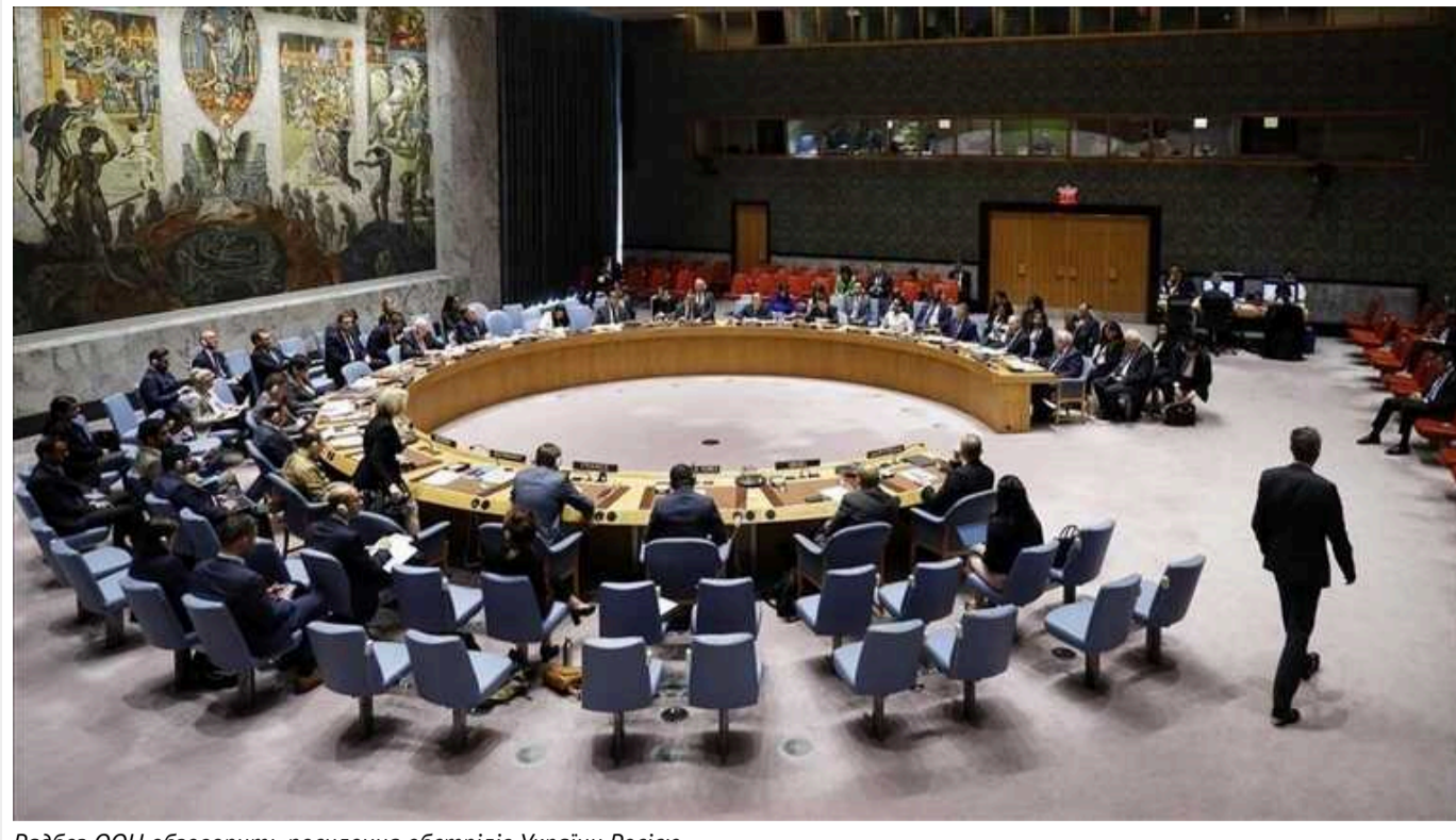
Радбез ООН обговорить посилення обстрілів України Росією

У вівторок, 14 травня, Рада безпеки ООН обговорить ситуацію в Україні, що утворилася через повномасштабне вторгнення Росії.