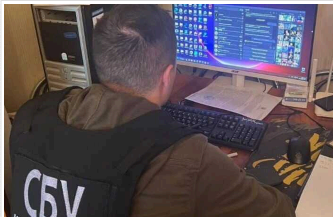
В Одесі СБУ накрила адміністратора ТГ-каналу, який писав про те, де у місті роздають повістки

СБУ заблокувала телеграм-канал, який допомагає ухилинцям уникати мобілізації на Одещині.