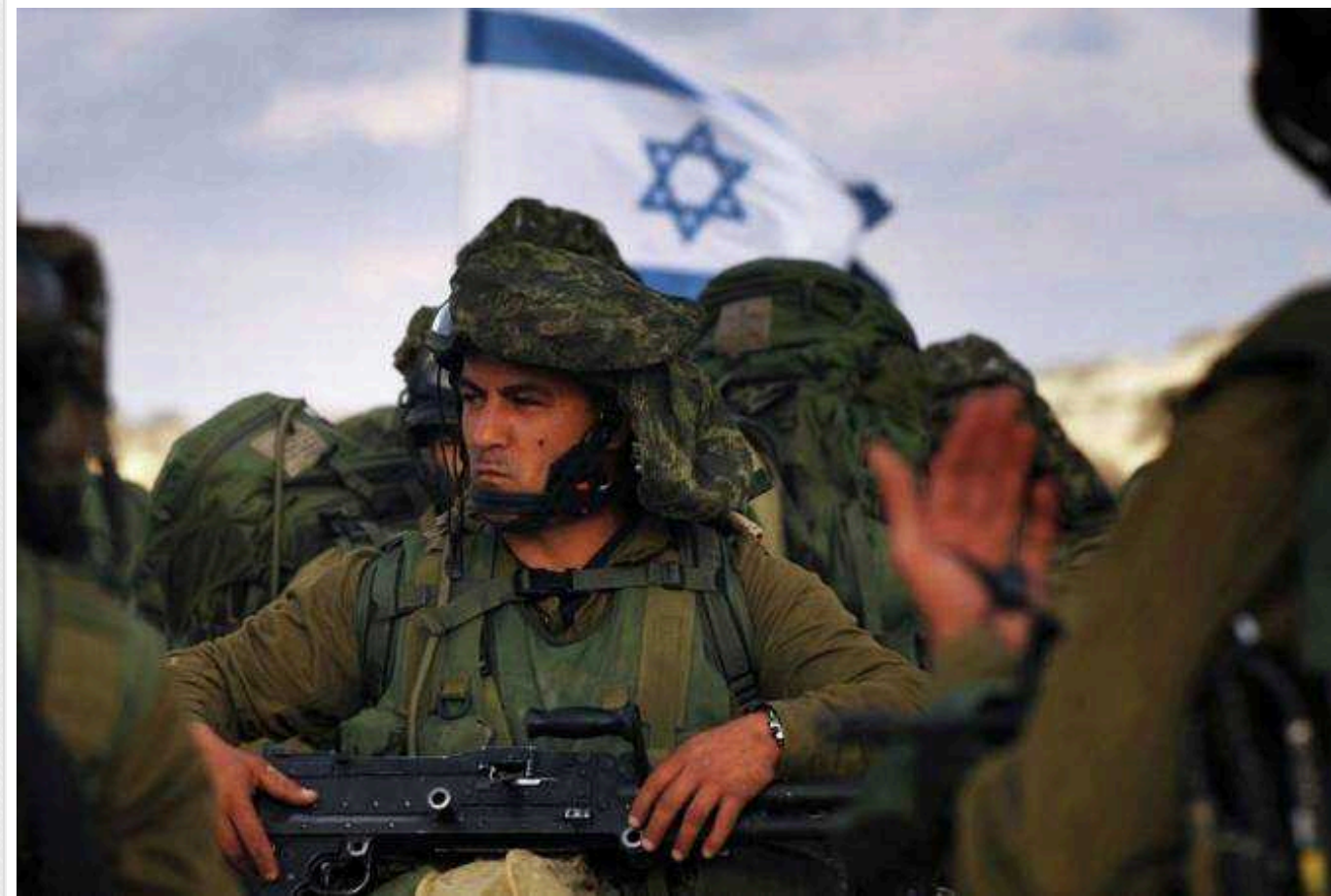
Bloomberg: Ізраїль, можливо, порушив міжнародне право у війні проти ХАМАСу

У дозгоочікуваному звіті Державного департаменту США йдеться про те, що Ізраїль, можливо, порушив міжнародне право у війні проти ХАМАСу, проте "характер конфлікту в Газі ускладнює оцінку або отримання переконливих висновків".