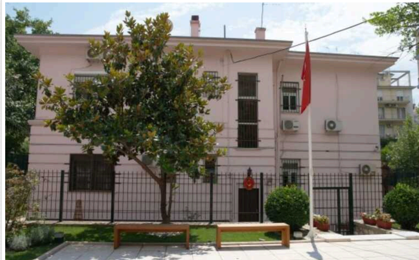
У Греції працівника турецького консульства засудили за шпигунство

Апеляційний суд Греції засудив колишнього співробітника турецького консульства до п'яти років ув'язнення за звинуваченням у шпигунстві.