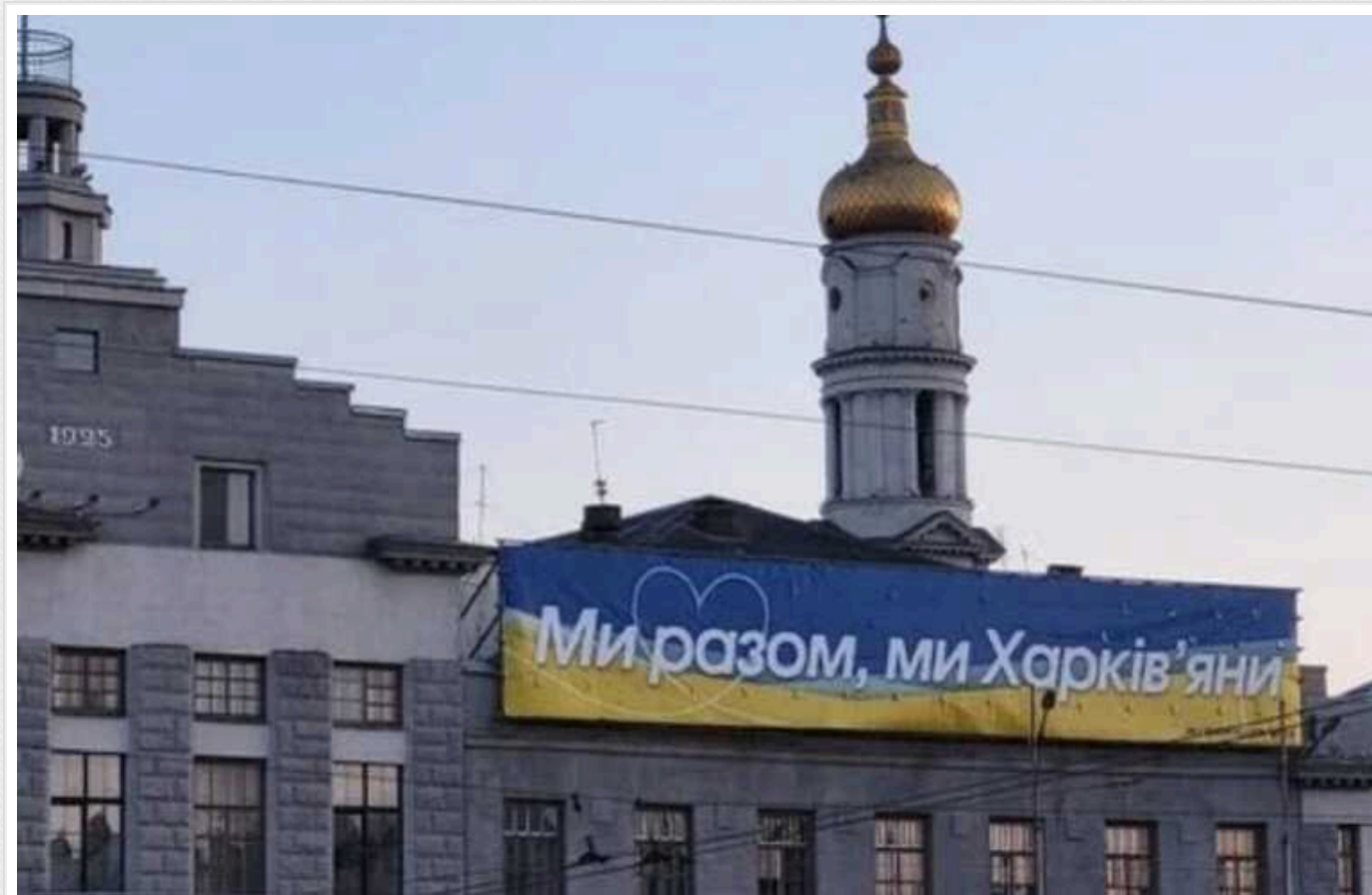
Операції РФ на Вовчанському напрямку не сприяють негайному просуванню до Харкова, – ISW

Обмежені зусилля, які зараз вживають російські окупанти, не свідчать про те, що йдеться про широкомасштабну наступальну операцію з метою оточити та захопити Харків, вважають в Інституті вивчення війни (ISW).