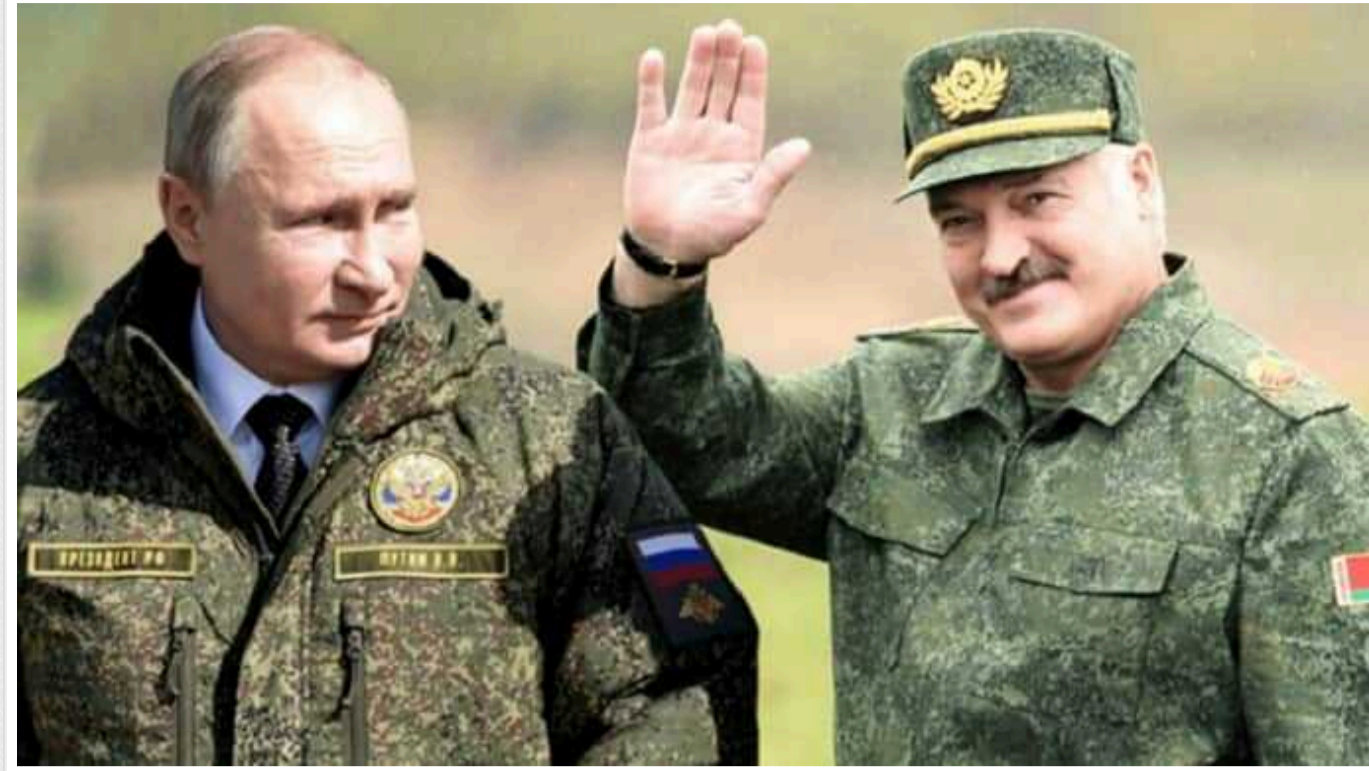
NYT: Білорусь неподалік кордону з Україною буде військовою базу, де, ймовірно, РФ зберігатиме ядерну зброю

Неподалік білоруського міста Осиповичі, що за 190 км від кордону з Україною, будують військовий об'єкт, на якому росіяни можуть зберігати ядерну зброю.