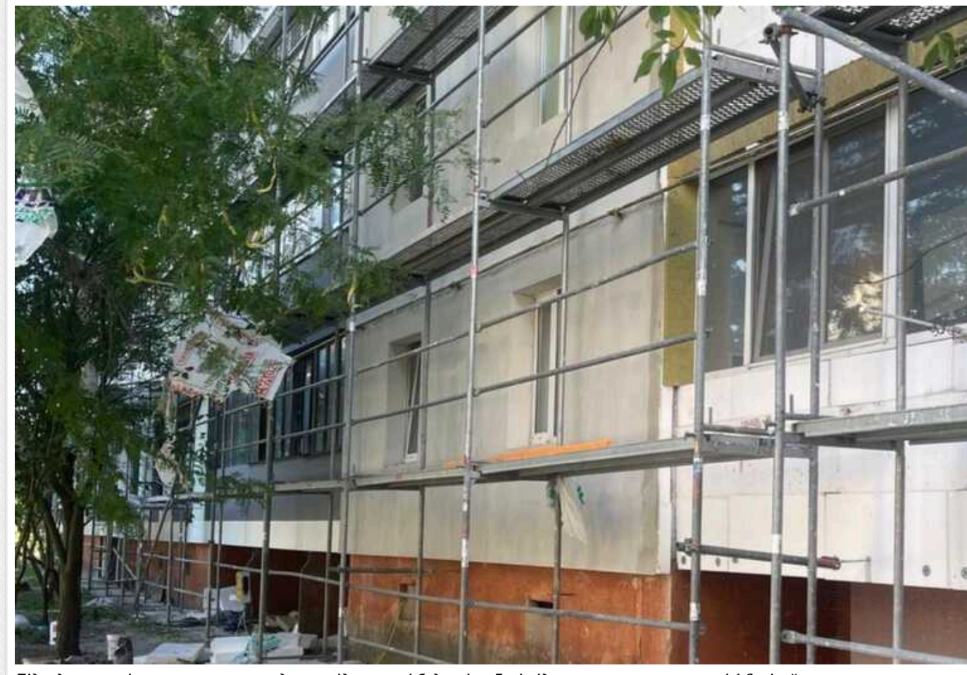
Підприємця та інженера з технагляду при відновленні будинків у Бучі підозрюють у привласненні 1,2 мільйони гривень

На Київщині правоохоронці повідомили про підозру у привласненні майна та службовій недбалості підприємцю та інженеру з технагляду. За даними слідства у Бучі, при відновленні будинків, пошкоджених внаслідок агресії РФ, фігуранти завдали громаді збитків на 1,2 млн гривень. Йдеться про завищенні дані вартості виконаних робіт та матеріалів, які було внесено в офіційні документи.