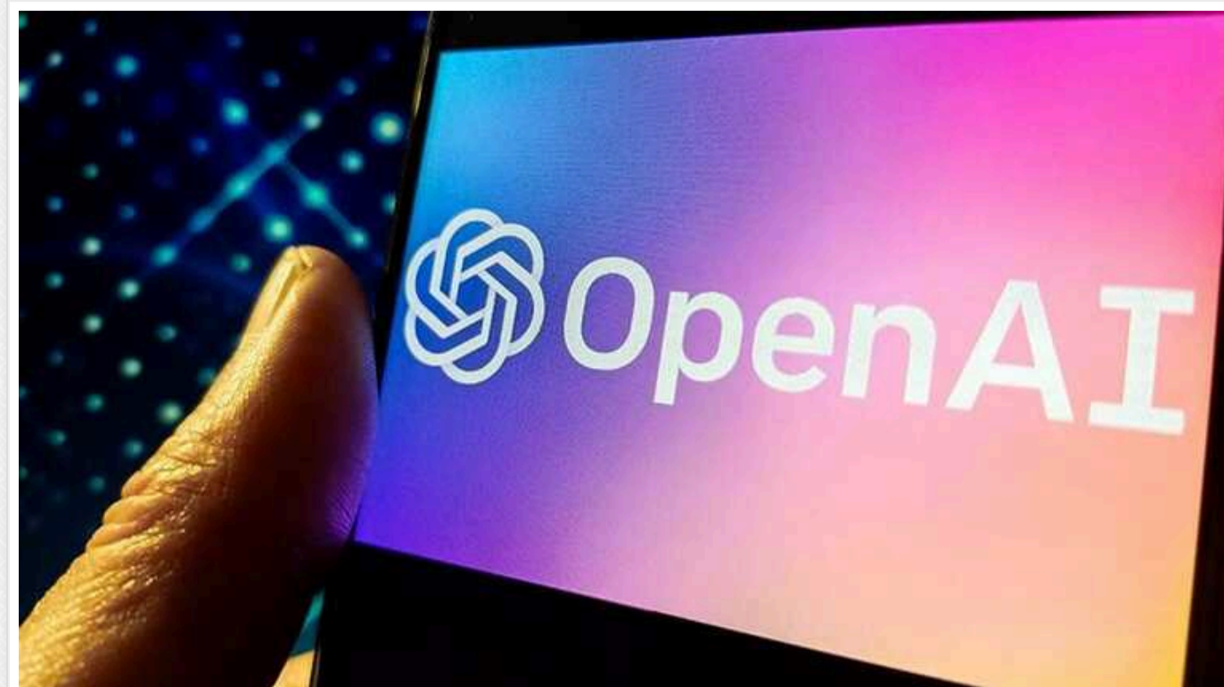
OpenAI анонсує ШІ-пошуковик у понеділок - за день до старту Google I/O

Влоотберг пише, що OpenAI у понеділок оголосить про створення власної пошукової системи, яку вже назвали «вбивцею Google».