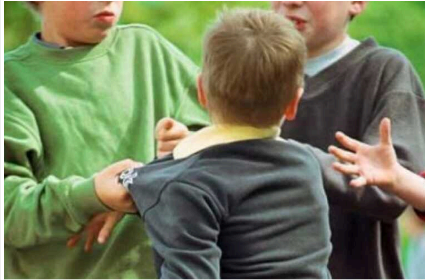
У Дніпрі група підлітків жорстоко побила дитину: вимагали гроші та телефон