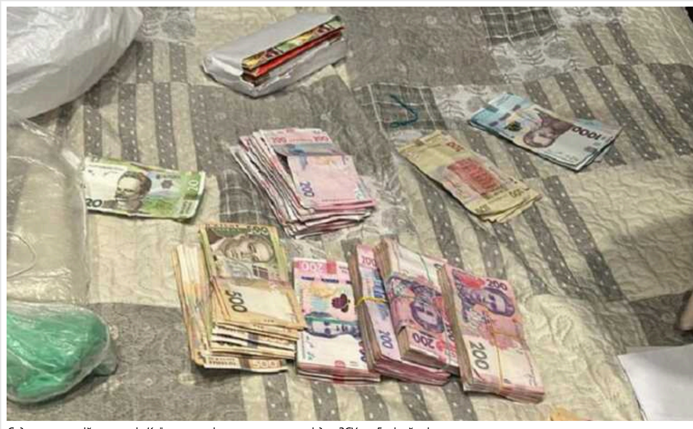
Судитимуть військових із Київщини, які привласнили харчі для ЗСУ на 5 мільйонів гривень

Працівники Державного бюро розслідувань завершили досудове розслідування стосовно організованої групи з-поміж військовослужбовців однієї з частин в Київській області та представників підприємства-постачальника харчових продуктів.