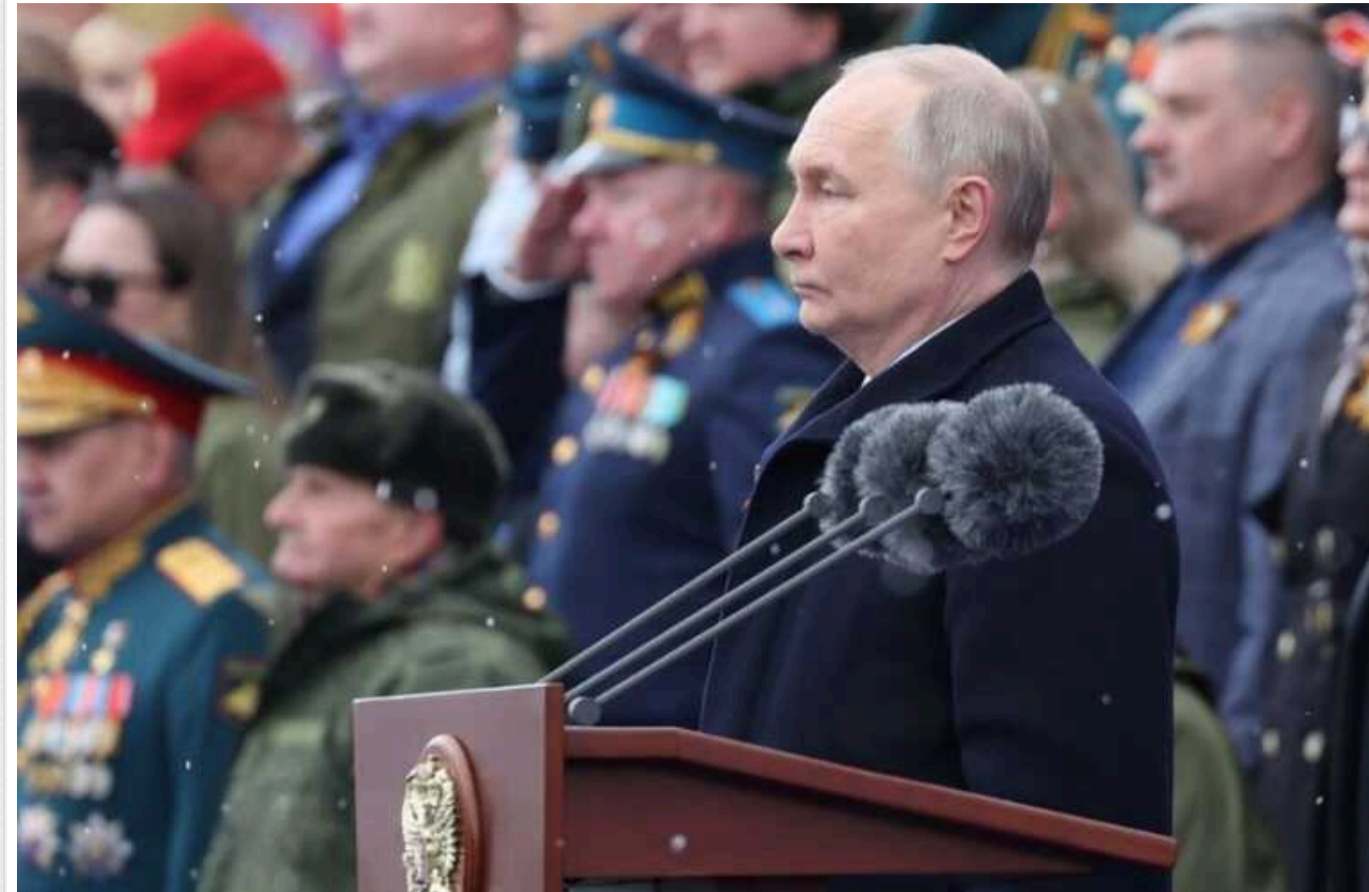
WSJ: Путін тепер використовує парад Перемоги, щоб залякувати Захід та виправдовувати війну проти України

Щорічний парад Перемоги на 9 травня тепер став трибуною для Володимира Путіна, щоб озвучити свою політичну програму, залякувати та критикувати Захід, а також виправдовувати вторгнення в Україну.