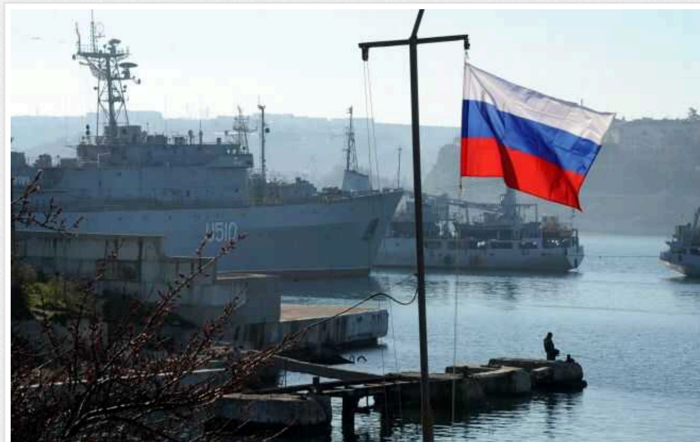
Агенти «АТЕШ» провели розвідку на території Севастопольської бухти

Партизани провели розвідку у Севастопольській бухті тимчасово окупованого Криму. Агентам руху опору вдалося зафіксувати там судна Чорноморського флоту РФ.