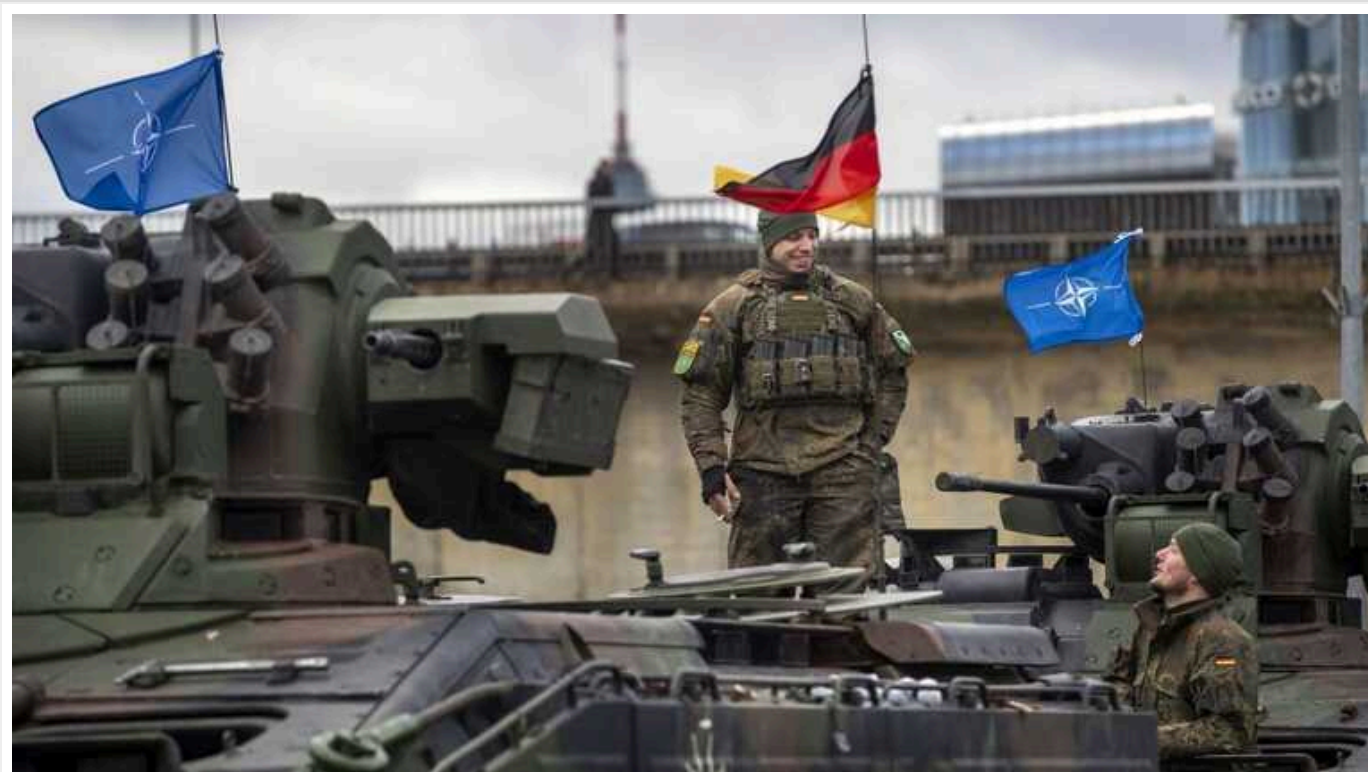
У Німеччині політики почали дискусію про відновлення призову

У Німеччині розвивається дискусія щодо можливого відновлення призову молоді до війська або на роботу у соціальних службах.