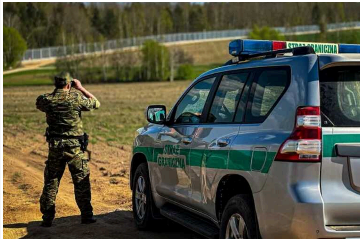
У Польщі хочуть побудувати бункери та вирити траншеї через російську агресію

Польща вживає "комплексних заходів" зі зміцнення кордону з Білоруссю та Росією. Наразі країна розмістила у відповідних районах військовий контингент, а також планує почати будівництво бункерів, ровів та траншей.