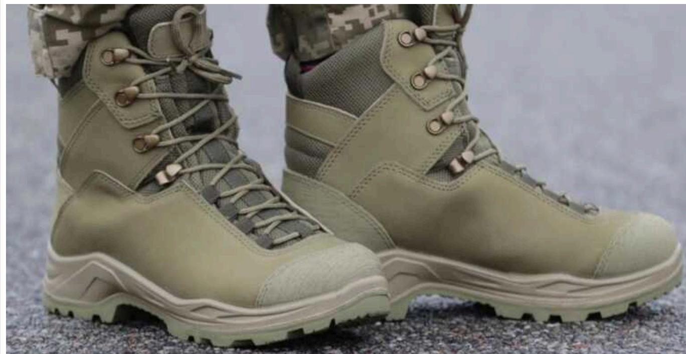
Міноборони у мільярдному контракті на 15% знизило доларову ціну на зимові чоботи для військових

Державне підприємство Міністерства оборони України «Державний оператор тилу» 3 травня уклало угоду з ТОВ «Таланлепром» на постачання 340 тисяч зимових берців на 871,69 млн грн (з ПДВ).