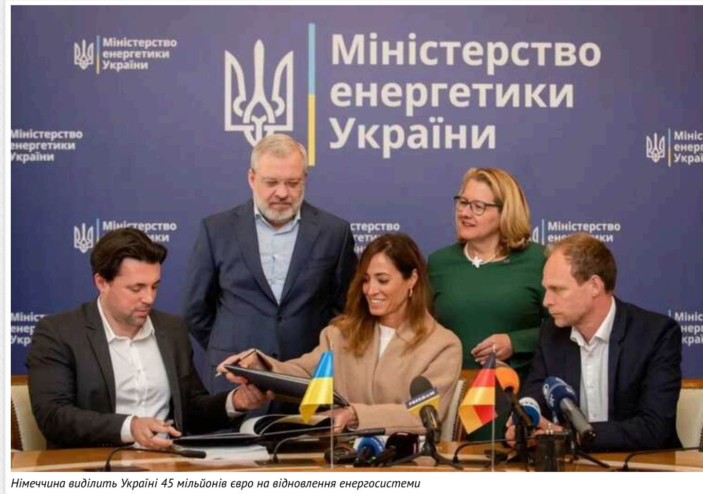
Німеччина виділить Україні 45 мільйонів євро на відновлення енергосистеми

Німеччина надасть Україні грант на 45 млн євро для відновлення енергетики.