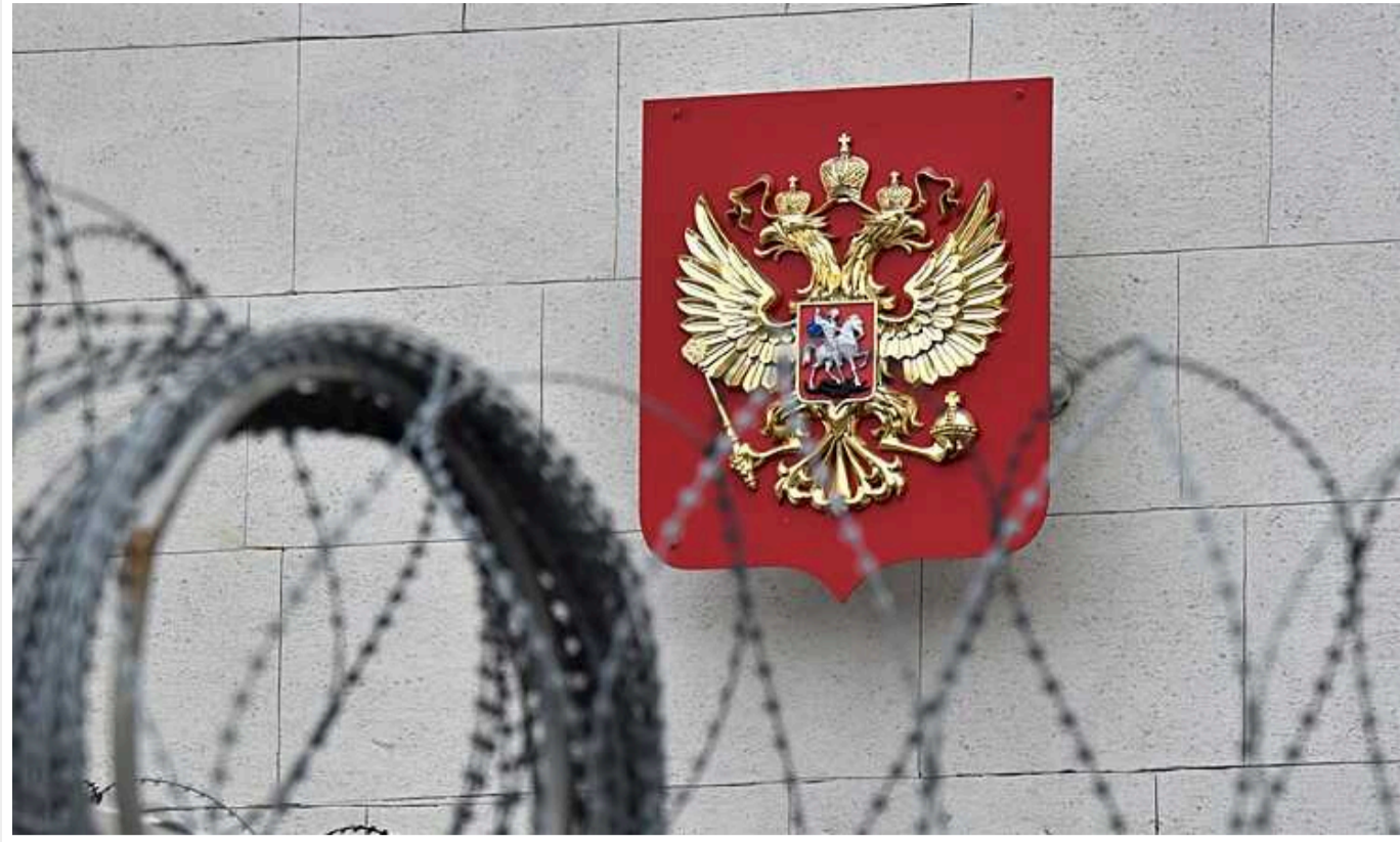
Bloomberg: Російські агенти почали активніше працювати в Європі

Військова розвідка РФ стала активніше працювати в країнах Європи. Для здійснення диверсій ГРУ наймає молодих людей через інтернет.