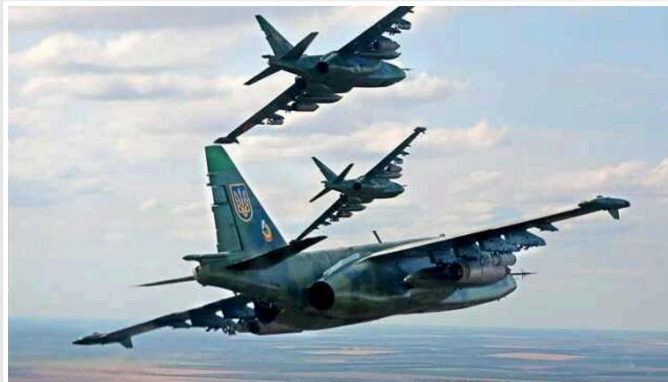
Ситуація на фронті: українська авіація та підрозділи ракетних військ ЗСУ завдали ударів по 18 ворожих об'єктах

Сили оборони України протягом доби відбили 54 атаки російських військ на шести напрямках, найбільше – на Бахмутському та Авдіївському.