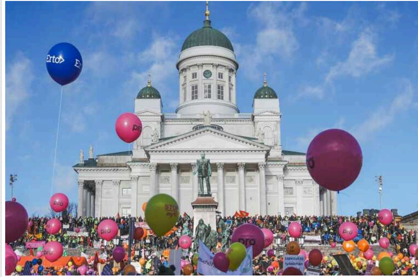
У Фінляндії заборонили проводити політичні страйки довше доби

Фінські депутати ухвалили закон, який обмежує термін політичних страйків, а також страйків на підприємствах.