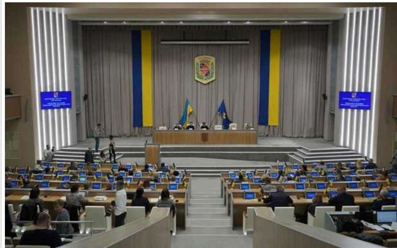
Полтавська облрада вирішила витратити майже 600 тисяч гривень на телевізійну рекламу діяльності депутатів

Полтавська обласна рада оголосила тендер на замовлення рекламних послуг про власну діяльність.