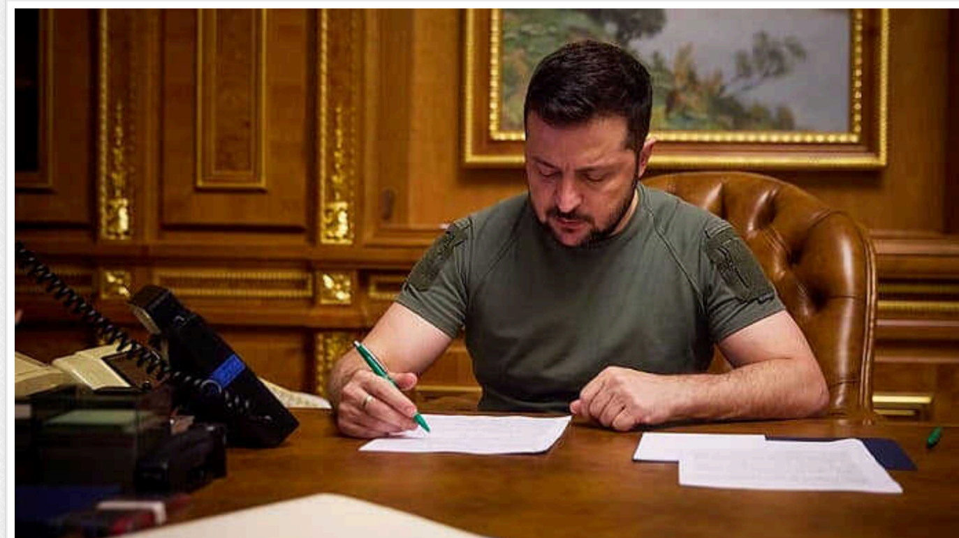
Зеленський підписав закони щодо продовження воєнного стану та мобілізації

Президент Володимир Зеленський підписав закони про продовження загальної мобілізації та воєнного стану в Україні до 11 серпня 2024 року.