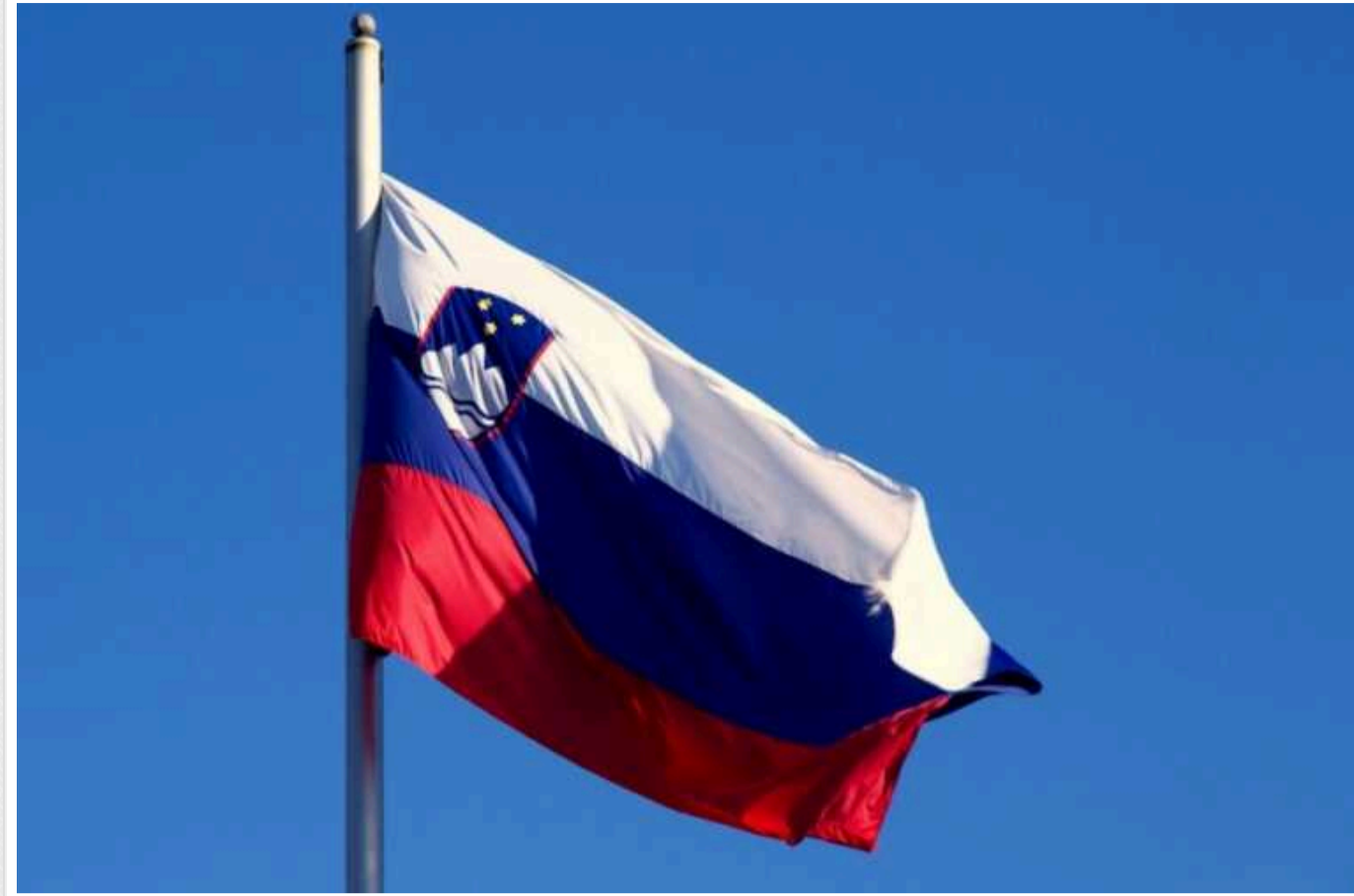
У Словенії розпочали процедуру визнання Палестинської держави

Уряд Словенії 9 травня ухвалив постанову про визнання Палестинської держави, яка тепер буде скерована до парламенту на затвердження.