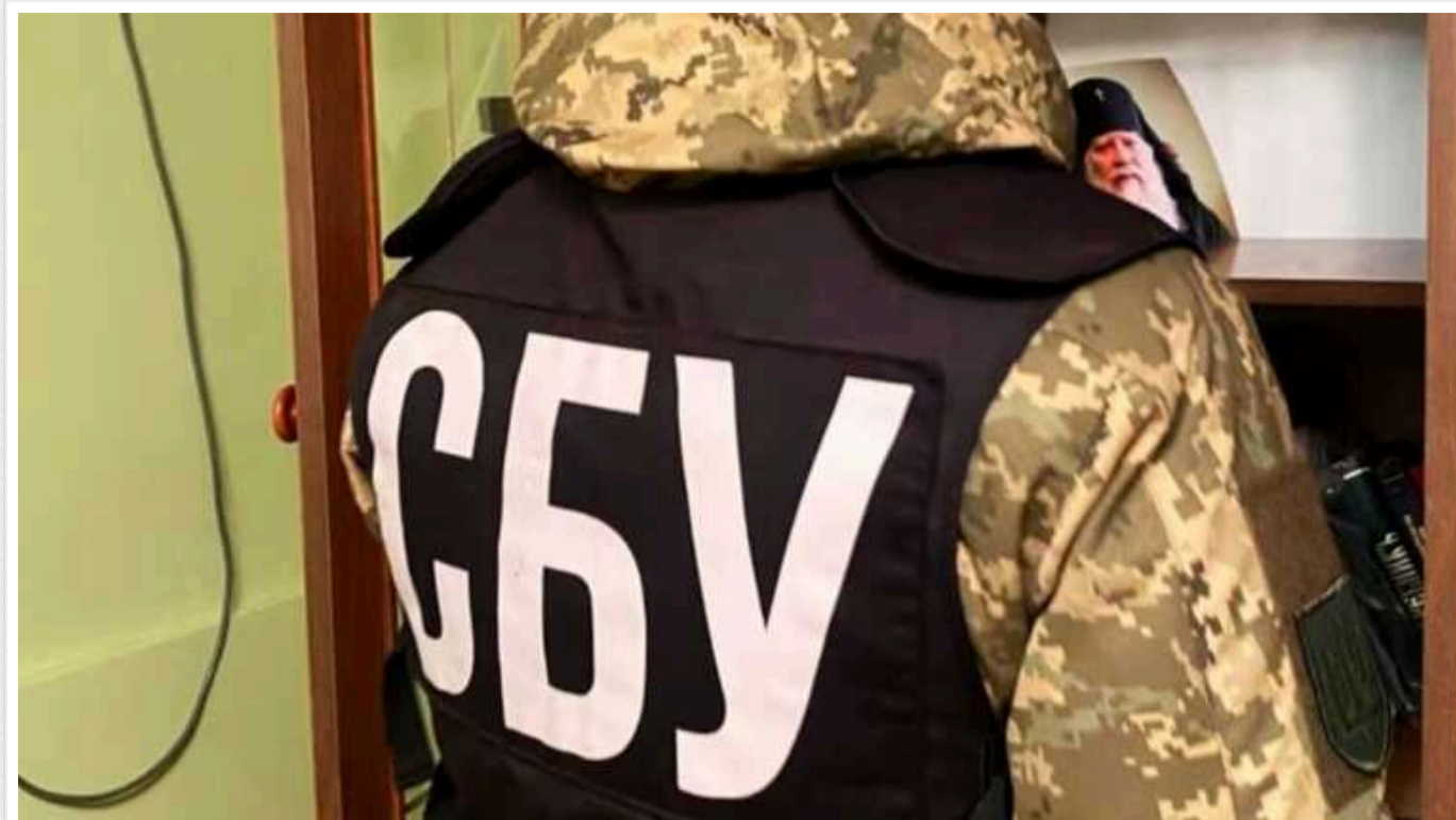
Клірику УПЦ МП, який агітував за приєднання Херсонщини до РФ, повідомлено про підозру

Клірику УПЦ Московського патріархату, який агітував за приєднання Херсонської області до складу Російської Федерації, повідомлено про підозру.