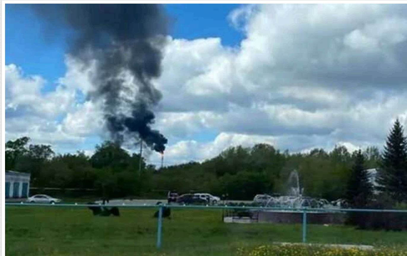
Удар по НПЗ у Башкирії влаштувала СБУ: дрон подолав 1500 км

Атаку по нафтопереробному заводу у Башкирії організувала СБУ. Перш ніж завдати удару, дрон пролетів рекордні 1500 км.