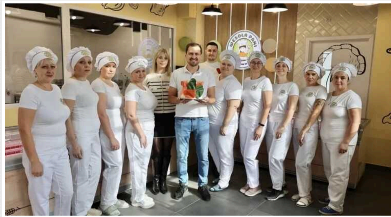
«Галя Балувана» за кордоном: у Ризі відкрився перший магазин «Wesota Pani»