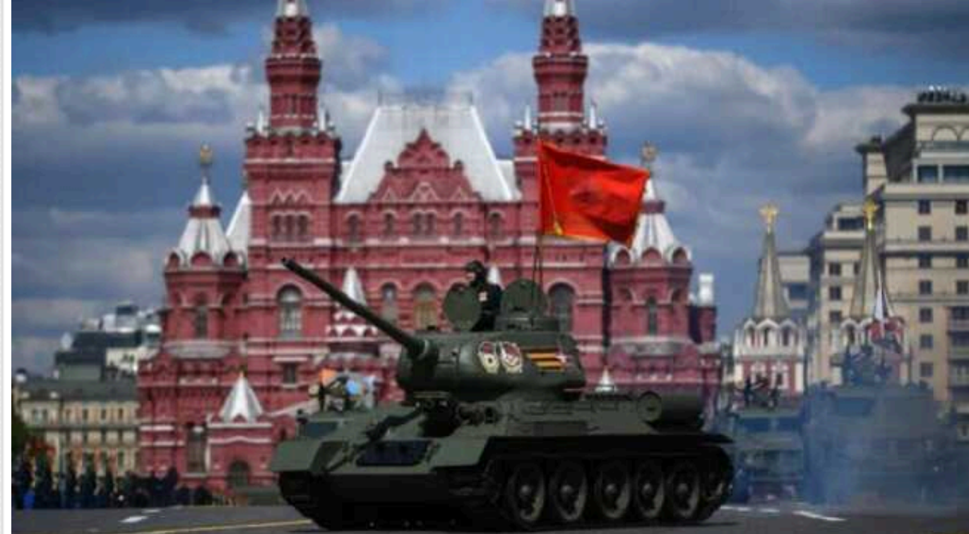
Хибні висновки Заходу, зроблені після Другої світової війни, наблизили напад РФ на Україну

Для того щоб підсумувати висновки, які зробив Західний світ після Другої світової війни, достатньо двох слів: «Never again» («Ніколи знову»).