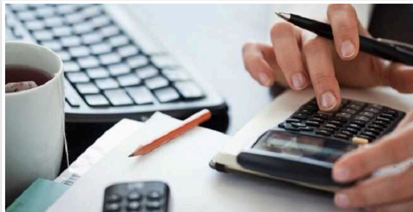
У Головному управлінні ДПС Львівської області немає коштів на конверти

Декілька днів тому ми повідомляли, що керівники ГУ ДПС різних регіонів України почали звертатись до територіальних громад для виділення коштів з місцевих бюджетів на діяльність податкового органу.